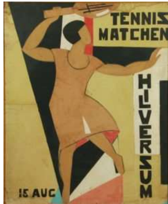
Otto van Rees: Tennismatchen, 1924