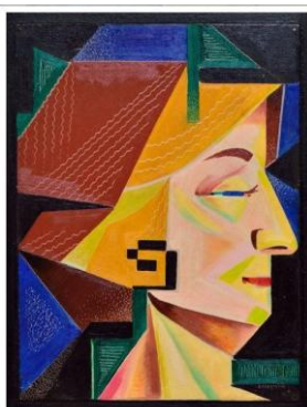
KUBISTISCH VROUWENPORTRAIT Olieverf op doek Datering: tweede 1920 / 1930 Olieverf op bordpapier Afmeting: 22,5 x 16,5 cm Beschrijving door Sierd Geertsma, Marinus Langhout, Kunsthistoricus en mede-eigenaar Museum Dr8888, in: Frans Dagblad d.d. 4 januari 2018

"Een merkwaardig talent", noemde in 1932 ooit een journalist Geertsma's werk. Zelfs voor kenners in die tijd zijn de schilderijen van de kunstenaar uit Appelscha niet in een hokje te plaatsen.