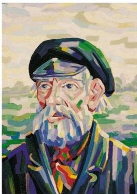
DE ZWERVER Olieverf op doek, 55x37 cm

Wellicht hebt u begrepen dat op 16 november jl. het bezit van de Stichting Leven en Werk beeldend kunstenaar Sierd Geertsma plechtig aan de Vrienden Stichting is overgedragen.