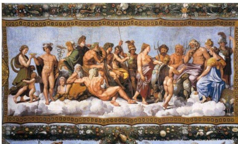
Rafaël, Bijeenkomst van de goden, 1515-1517, plafondfresco in de loggia van Villa Farnesina, Rome

Eens in de vier jaar kan alles toch volstrekt anders worden?