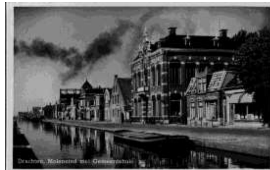
2 Oude foto van Gemeentehuis op Moleneind jaren 30