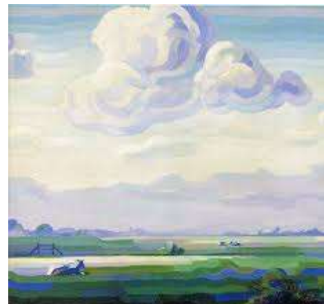
13 Sierd Geertsma Wolken ca. 1927 olieverf op doek, collectie Museum Dr8888

Toen de voorzitter van ons museum en ik woensdagmiddag naar Appelscha reden, wisten wij niet wat ons stond te wachten. Onze stoutste verwachtingen werden overtroffen! Namens heel de Stichting zeg ik u nogmaals hartelijk dank voor de buitengewoon vriendelijke ontvangst.”