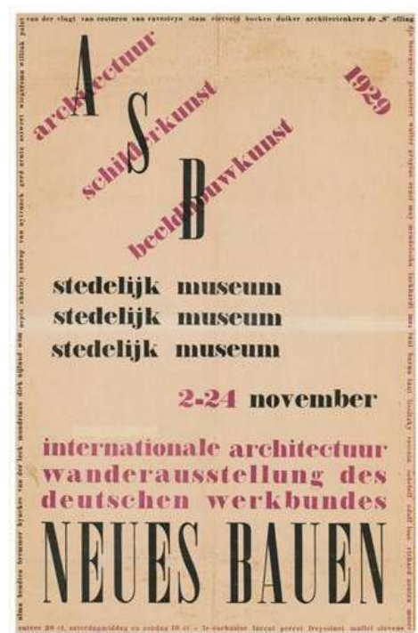
7. Affiche voor tweede tentoonstelling van ASB in Stedelijk Museum Amsterdam in 1929