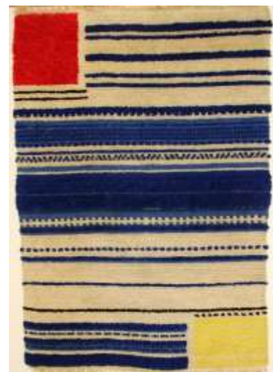
25 Hans Polak Tapijt geïnspireerd op De Stijl 1933 wol Museum Dr8888

Textilia: Museum Dr8888 heeft 360 geregistreerde objecten van textiel. Het gaat om antieke merklappen, rouwkleden, onderjurken, vlaggen, vaandels, kousen, beenwarmers, hoeden, mutsen, etc. Bijzonder voor de kerncollectie is een kleed, ontworpen door Rietveld, Van der Leek of Huszár i.o.v. het PAAPJE. Het PAAPJE heeft een lange, rijke historie. Al in 1930 begon PAAPJE in Voorschoten als weverij en vanaf 1937 werd het bedrijf uitgebreid met een handzeefdrukkerij. PAAPJE wist veelbelovende kunstenaars en ontwerpers aan zich te binden die de artistieke en moderne prints ontwierpen. Zo maakte de Nederlandse Cobra-kunstenaar Karel Appel in 1953 een ontwerp voor PAAPJE (collectie Stedelijk Museum Amsterdam, zie afbeelding). PAAPJE was een broedplaats, een plek waar geëxperimenteerd kon worden en waar textiel werd ontwikkeld dat onderdeel werd van het Nederlandse design landschap. PAAPJE ging samenwerken aan met architecten die de stoffen toepasten in hun projecten en interieurs. Zo maakte PAAPJE interieurtextiel voor de Nederlandse architecten J.P.J. Oud en W.M. Dudok.