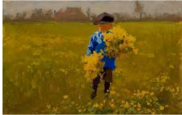
16 Ids Wiersma Jongetje (Ids jr.) met bosje Dotterbloemen ca.1921 olieverf op paneel. Collectie Vrienden van Museum Dr8888

In de tentoonstelling "Monet & Van Gogh van Friesland" van het Museum Dr8888 waren meer dan 150 werken tentoongesteld van Wiersma en van zijn collega schilder Sierd Geertsma. Met 630 werken heeft Museum Dr8888 verreweg de grootste collectie van Wiersma. Mede door dit feit is het Museum niet actief in het verzamelen van werken van Wiersma, tenzij het tot zijn topwerken behoort, zoals zijn op klein formaat geschilderde impressionistische werk.