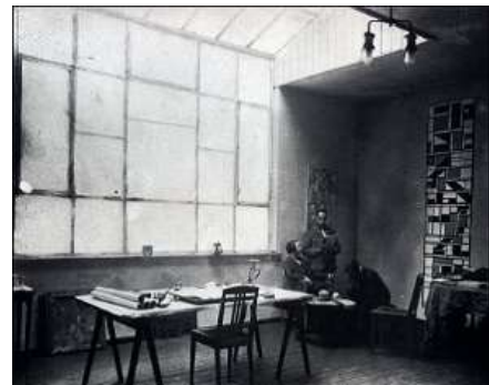
6 Theo Van Doesburg en Nelly in studio Am Schanzengraben 8 Weimar met op achtergrond Grote Pastorale