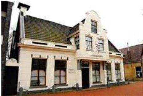
1 Het Bleekerhûs in 2012

Museum Drachten heeft heel wat naamsveranderingen ondergaan. Het museum begon ooit eind 1936 als Stichting Oudheidkamer Smallingerland, en heette vanaf de verhuizing in 1952 It Bleekerhûs.