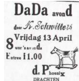
9 Kurt Schwitters aankondiging Dada in Drachten Dragster Courant 12 april 1923