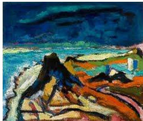
14 Pier Feddema Cosmos (Ameland) , 1958 olieverf op doek collectie Museum Dr8888