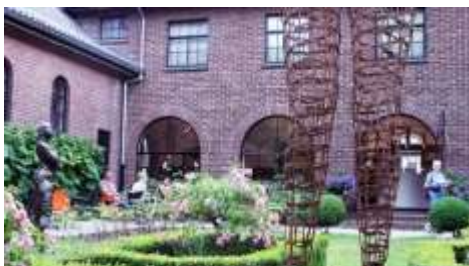
3 Beeldentuin Museum Dr8888

Na de verhuizing in 1979 naar het Moleneind, een gebouw waar tot dan toe het