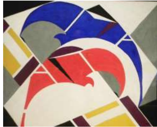
8 Thijs Rinsema Zonder Titel (Ruiters) , Gouache 1925, Collectie Ottema Kingma Stichting, permanente bruikleen Museum Dr88888

Thijs Rinsema: Thijs Rinsema (Drachten, 18 juni 1877 - aldaar, 1 maart 1947) was een Nederlands kunstenaar die zowel schilderijen maakte, als meubels en collagedoosjes ontwierp. Thijs hield zich, net als zijn jongere broer Evert, met schoenmaken bezig, wat hij tot een jaar voor zijn dood volhield. Door zijn broer kwam Thijs in aanraking met Theo van Doesburg en zijn werken, waardoor Thijs steeds meer in de richting van diezelfde stijlen: Kubisme, Constructivisme De Stijl en Dada, begon te schilderen. Hij ontmoette langzamerhand andere bekende kunstenaars en kreeg zelfs een derde prijs voor een van zijn ontwerpen.