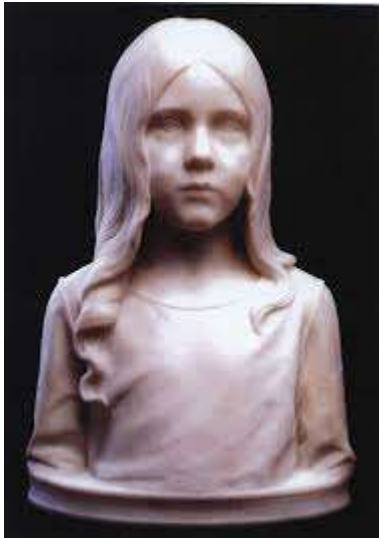
15 Pier Pander Portretbuste van jong meisje , ca. 1905, marmer, collectie Museum Dr8888

Het jaar 1897 wordt genoemd als het jaar van de definitieve nederlaag van de academische kunst. In dit jaar werd in het Musée du Luxembourg een alternatieve Salon gehouden waar moderne schilders als Paul Cézanne, Edgar Degas, Édouard Manet en Claude Monet mochten exposeren. De opening van het Musée d'Orsay in 1986 werd door sommige critici gezien als een rehabilitatie van het academisme en beschouwd als revisionisme.