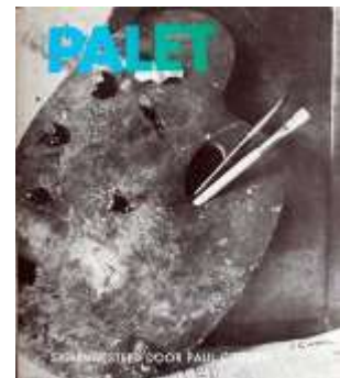
4 Omslag boek Paul Citroen Palet Een boek gewijd aan de hedendaagsche Nederlandsche Schilderkunst 1931

Museum Dr8888 heeft een grote collectie beeldende kunst die voor meer dan de helft geproduceerd is tussen 1914 en 1945, een periode waarin heel veel gebeurde in de wereld en ook in die van de kunst. De twee wereldoorlogen hadden veel invloed op de hele maatschappij, op de beeldende kunst, architectuur en het opkomend design. Het Interbellum was een tijd van razendsnelle ontwikkelingen: gestroomlijnde auto's die steeds meer het straatbeeld gingen bepalen, de opkomst van snelwegen, elektrische huishoudelijke apparatuur en de elektrische tram. In de film ontstond een platform voor de kunstfilm, De Filmliga . De reclame werd volwassen en het modernisme kreeg invloed op het leven van alledag. Ook het ontstaan van de vele -ismes, manifesten en Soirées , zijn onder andere uitingen van die bewogen periode. Een