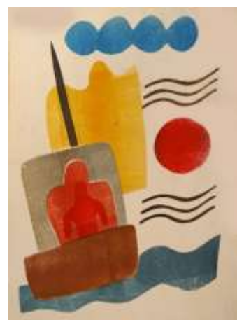
12 H.N. Werkman Hotprinting 6, man in boot , 1936 druksel collectie Vrienden Museum Dr8888