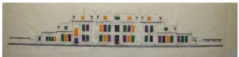
7 Theo van Doesburg ontwerp kleuren RLW Drachten 1921