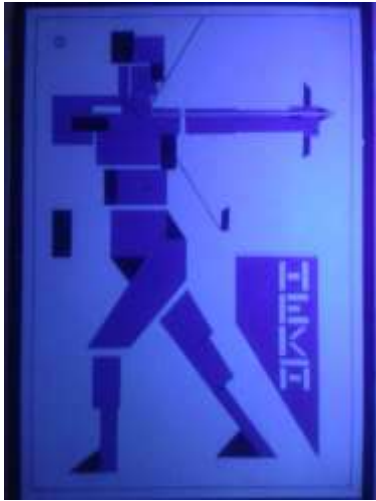
27het werk van Van Doesburg onder tijdens onderzoek bij RCE