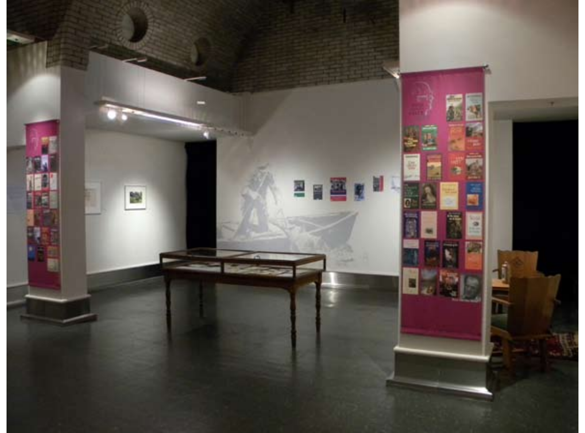
Bezoek Singelland aan tentoonstelling Zilveren Camera in 2010