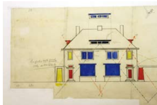
Theo van Doesburg, kleuroplossing voor het exterieur