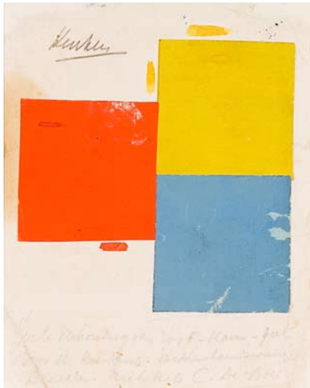
Theo van Doesburg, kleurharmonie voor de keuken