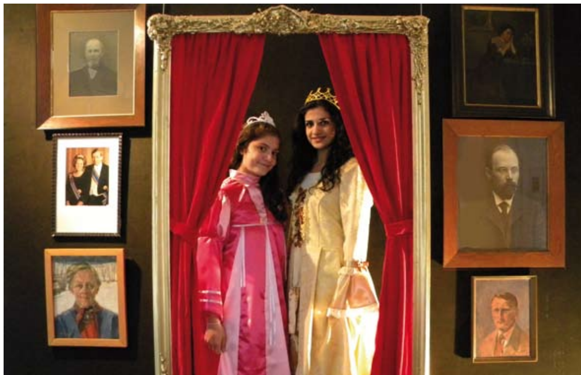
Actie koninginnedag 2010, bezoekers geportretteerd als koningin